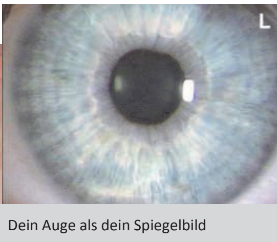
Dein Auge als dein Spiegelbild

Die Iridologie ist ein hinweisdiagnostisches Verfahren, dass aus Aussehen und Veränderungen der Iris Erkenntnisse gewinnt, die im Kontext der Patientenbefragung (Anamnese) für bestimmte Rezepturen und weiterführende Maßnahmen wegweisend sein können.